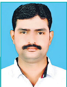
శివపల్లి సైకాలజీ ఫ్యాకల్టీ AKR స్టడీ సర్కిల్ వికారాబాద్, తాండూరు